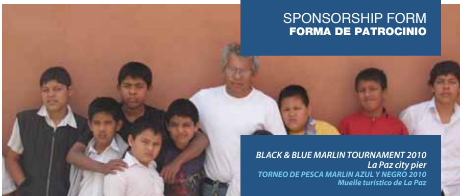
BLACK & BLUE MARLIN TOURNAMENT 2010 La Paz city pier TORNEO DE PESCA MARLIN AZUL Y NEGRO 2010 Muelle turístico de La Paz